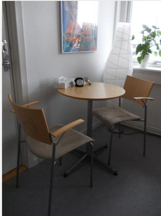
[billede 2: kontor]