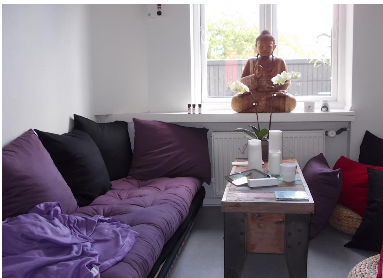
[billede 3: af Buddha]

I Helsingung har medarbejderne lige som os forskere en opmærksomhed på, hvilken betydning rumlige aspekter har for det sociale arbejde. De eksperimenterer derfor med forskellige former for samtalerum. Et af disse er 'Buddha' som er afbilledet herunder.